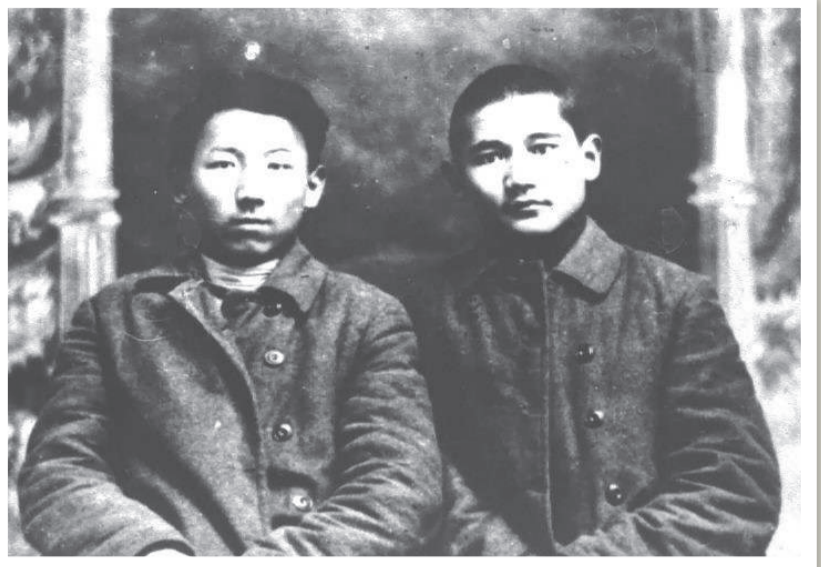
Бауыржан Момышұлы Әбділда Тәжібаевпен бірге. Шымкент қаласы, 1925 ж.