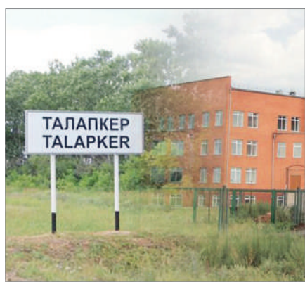
ТАЛАПКЕРДІҢ ТАЛАБЫ ҚАНДАЙ?