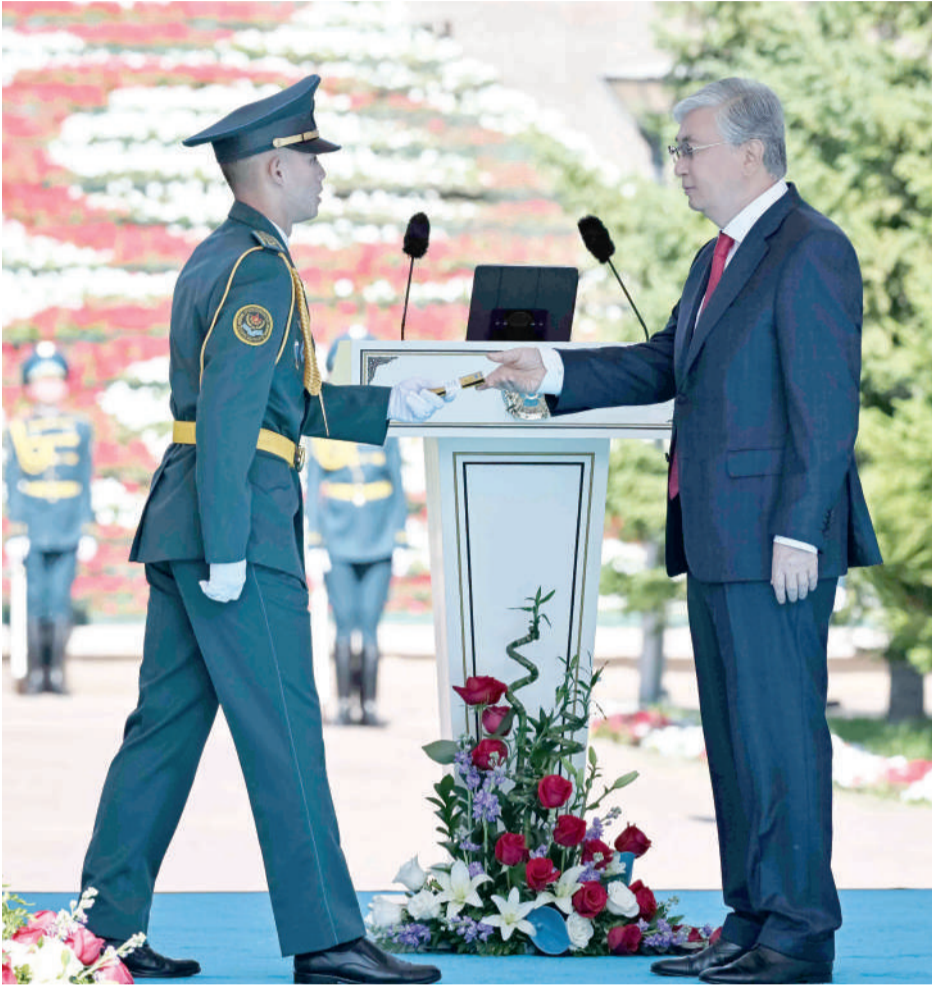
(Соңы. Басы 1-бетте)

Президент Қасым-Жомарт Тоқаев жиналған қауымды мемлекеттік рәміздер күнімен құттықтап, олар егемендік пен елдіктің ең басты белгісі екенін атап өтті. «Көк байрағымыз, Елтаңбамыз және Әнұранымыз – күллі халқымызға қастерлі нышандар. Біз үшін тәуелсіздік – ең қымбат құндылық, ал туымыздың асқақ желбірегені – аса биік мәртебе. Батыр бабаларымыз сын сағатта әрдайым бір тудың астында жиналған. Бөрілі байрақ күллі түркі жұртын біріктірген. Абылай ханның ақ туы бүкіл қазақтың басын қосқан. Алаш туы арыстарымыздың жігерін жанып, намысын қайраған. Біз бабаларымыздың даңқты жолын жалғастырып келеміз. Байрағымыз Біріккен Ұлттар Ұйымының төрінде