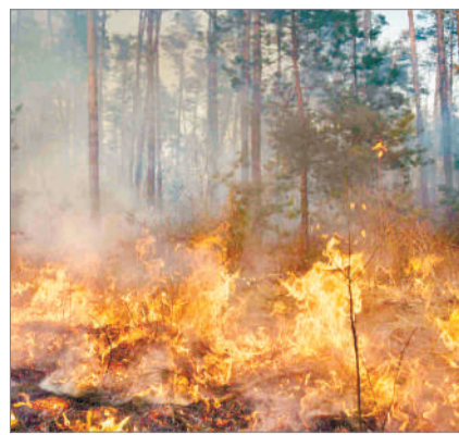
АПАТ АШҚАН АҚИҚАТ