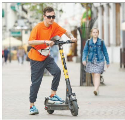
САМОКАТ ҚАҒЫП КЕТПЕСІН