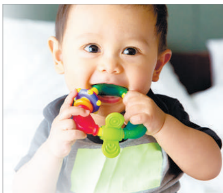
ШЫҒАСЫҒА ИЕСІ БАСШЫ

Бүгін Түркістан қаласында Мемлекет басшысы Қасым-Жомарт Тоқаевтың қатысуымен Ұлттық құрылтайдың екінші отырысы өтеді. Кеше Ұлттық құрылтай мүшелері жеке талқылау блоктарында азаматтық қоғамды дамыту және этносаралық бірлікті нығайту, қоғамдық бірлестіктердің қызметін заңнамалық реттеу, ұлттық идеологияның күн тәртібін қалыптастыру ерекшеліктері, өңірлердегі қоғамдық кеңестердің рөлі мәселелерін талқылады.