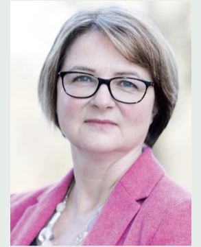
Кэти ЛЕЧИ, Ұлыбританияның Қазақстандағы елшісі: