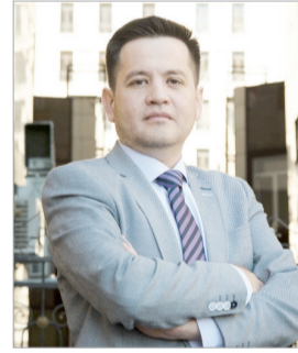
Серік БЕРКАМАЛОВ, Қазақстан заңгерлер одағының атқарушы директоры:

– Біз Конституция күнін бейресми түрде заңгерлер күні ретінде атап өтеміз. Өйткені заңгерлер заңның орындалуына мүдделі танытып, ел тыныштығы мен тұрақтылығы үшін жұмыс істейді.