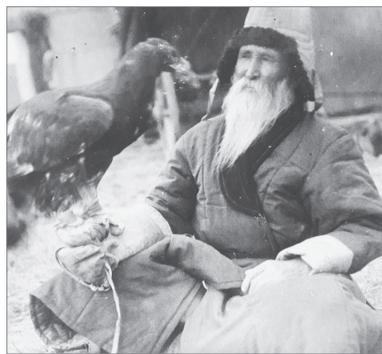
ШӘКӘРІМДІ СУРЕТКЕ ТҮСІРГЕН КІМ?