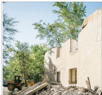
АПАТТЫ ҮЙЛЕР АЗАЙЫП КЕЛЕДІ