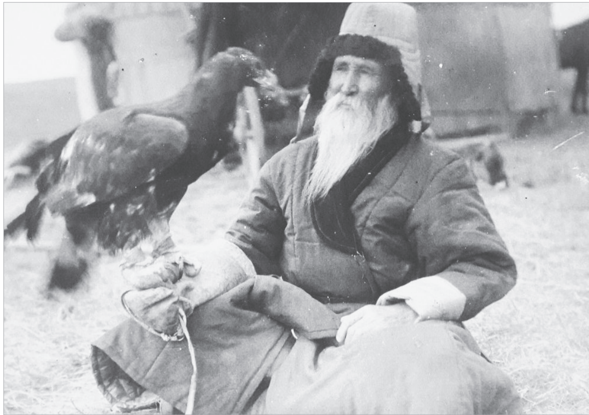
Шәкәрім Құдайбердіұлының есімімен байланысты қазақ даласын зерттеуге келген экспедицияның бірі - құрамында Ресей этнографы Фёдор Артурович Фиельструп болған 1926-27 жылғы этнографиялық экспедиция.