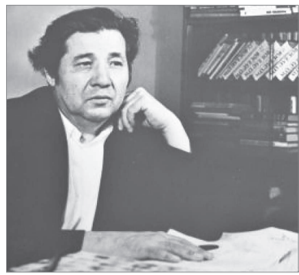
ҚАСИЕТІ ДАРА ҚАЛАҒА