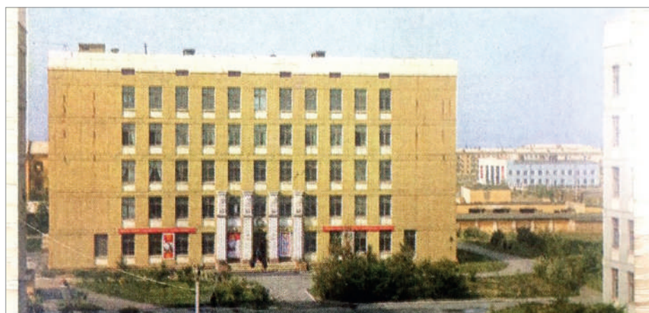
Суретте Целиноград мемлекеттік медицина институтының ғымараты. 1971 жылдың тамыз айы.

Тың игерушілердің денсаулық сақтау мәселелерін шешу үшін Қазақстан Коммунистік партиясының Орталық комитеті қаулысымен Тың өлкелік комитеті мен Еңбекшілер депутаттарының өлкелік кеңесінің атқару комитеті 1964 жылы 9 сәуірде «Целиноград қаласында медициналық институт ашу туралы» шешім қабылдады.