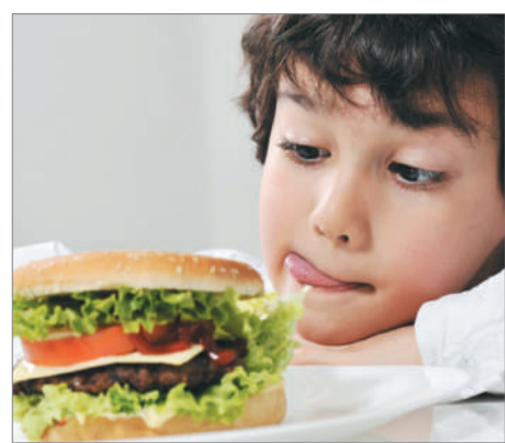
ТАҒАМНАН ТӨНГЕН ҚАУІП