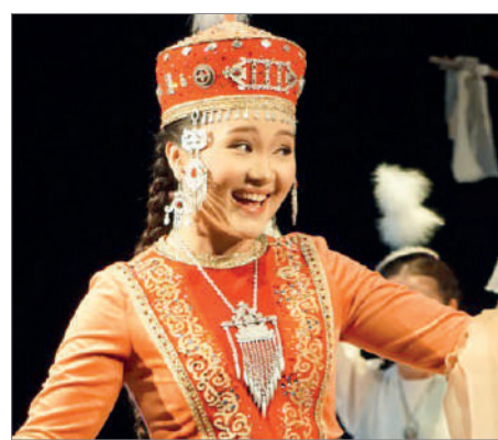
ҚАЗАҚ КЕЛІНІНІҢ КЕЛБЕТІ