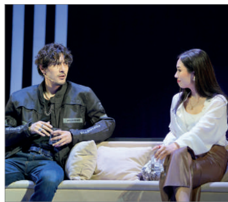
БАЯНДЫ ЖӘНЕ БАЯНСЫЗ МАХАББАТ БАЯНЫ