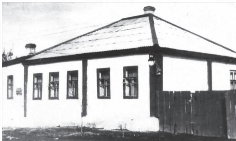
Ақмолада С.Сейфуллиннің өзі тұрған үйі