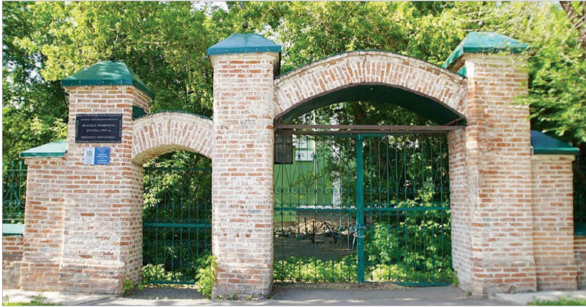
С.Сейфуллин 1912 жылы алғаш сабақ берген мектеп. Қазіргі Абай даңғылы, 83 мекенжайында орналасқан